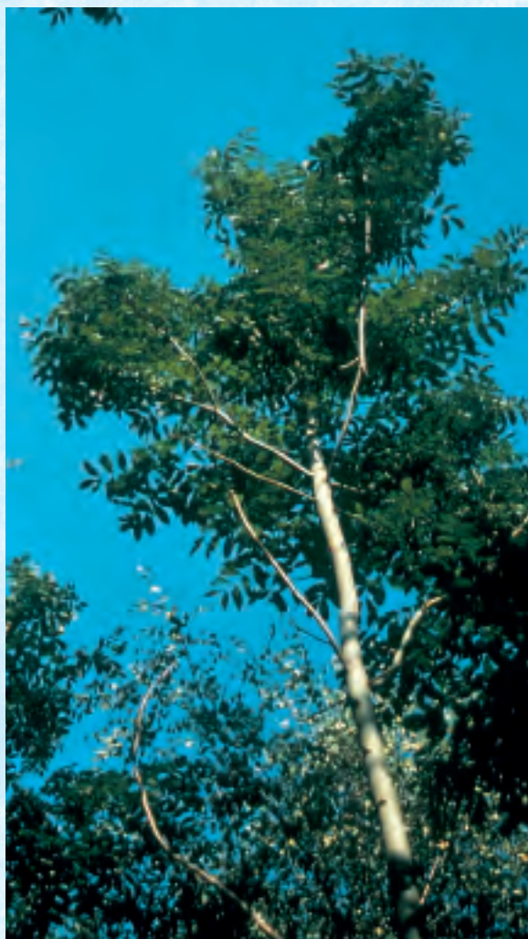
Arbre détouré : le houppier a désormais la place de se développer.