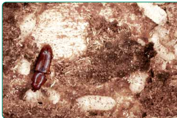
Le rhizophagus grandis régule les populations de dendroctones à l'origine d'importants dégâts dans les pessières.