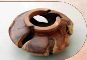
Loupe de cade tournée DE C. VERCHOT