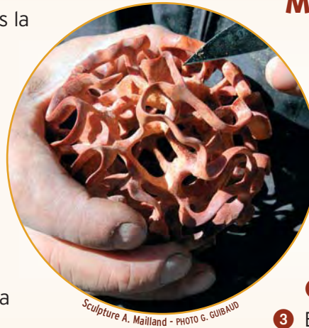
Sculpture A. Mailland