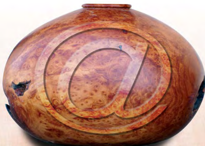
Vase loupe de bruyère de M. de Malet