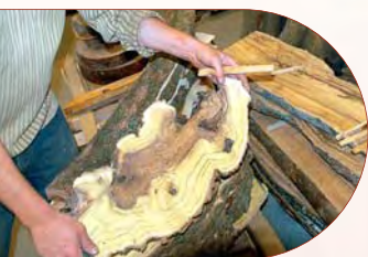
Plateaux de mûrier "Luminescences"

Certains de ces bois peuvent nécessiter des conditions particulières d'exploitation, de sciage, de conservation, de débit... Le service Annuaire des professionnels de Bou'd'Boa a pour objectif de faciliter la connaissance de ces professionnels spécialisés.