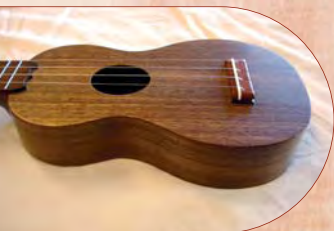
Ukulele en noyer noir DE D. CHEVALIER