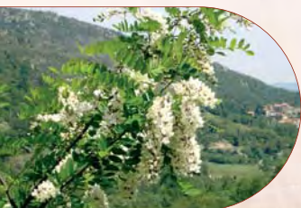
Robinier faux acacia