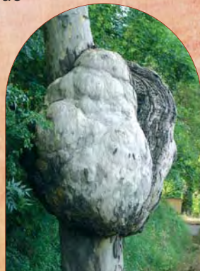
Loupe de platane